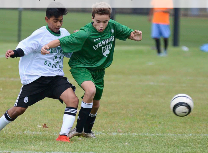
Foto del torneo de soccer de la Junta de Parques y Recreación de Minneapolis

Compartir narrativas y elevar voces más allá del contexto cultural dominante a través del desarrollo de una colección de arte público y de recordación que refleje la historia diversa de nuestra ciudad y la tierra de parques incluyendo el contexto cultural completo de la ciudad.