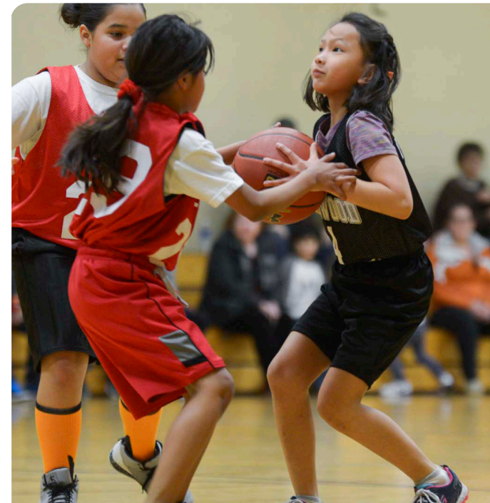
Baloncesto juvenil en Parques de Minneapolis

Prevenir la violencia y mitigar su impacto en la salud pública, percepciones de seguridad y seguridad en el sistema de parques