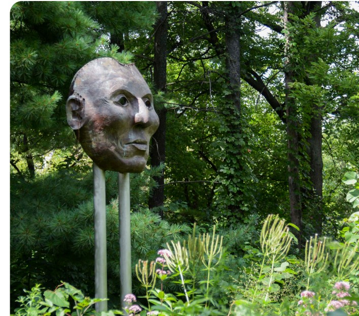
Escultura de la Máscara del Jefe Indio Pequeño Cuervo en Minnehaha

09 Mejorar la accesibilidad de las comunicaciones impresas y en línea con el público, incluyendo el uso actualizado de medios digitales.