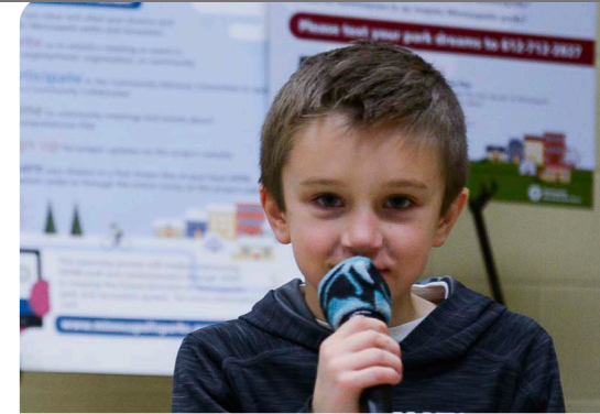
Parques Para Todos y Colaborador de alcance a la Comunidad en el evento de Solsticio de Invierno en McRae