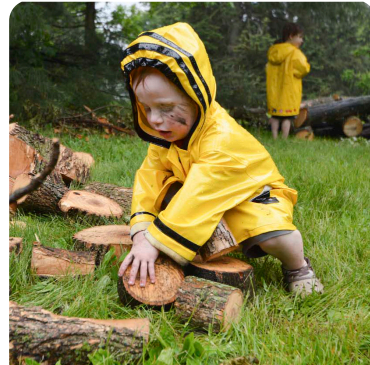
Niños jugando en el espacio de juegos naturales en Lake Nokomis

12 Invertir en juegos y programas basados en la naturaleza para todas las edades.