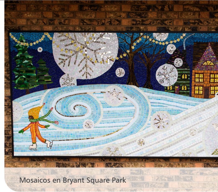
Mosaicos en Bryant Square Park

Mejorar las oportunidades y eliminar las barreras de trabajos para las personas que no cuentan con un techo donde vivir.