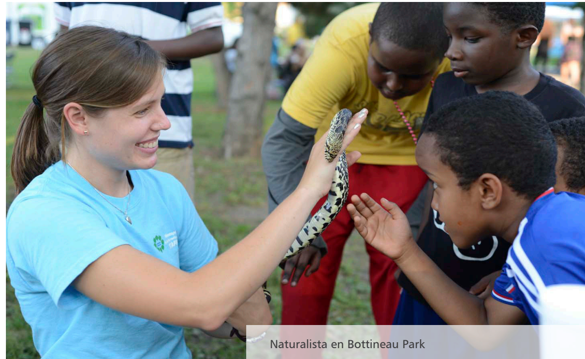
Naturalista en Bottineau Park

Proponer nuevas leyes, penalidades, prevención, intervención de la violencia de las armas, incluyendo el abogar por la prohibición del uso de armas en los establecimientos de los parques.