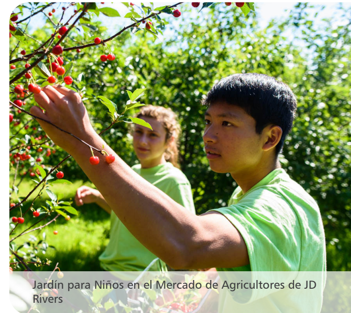
Jardín para Niños en el Mercado de Agricultores de JD Rivers

Promover conexiones significativas para espacios naturales en nuestro sistema de parques mediante la educación, programación, interpretación, experiencias, voluntariado e instalaciones.