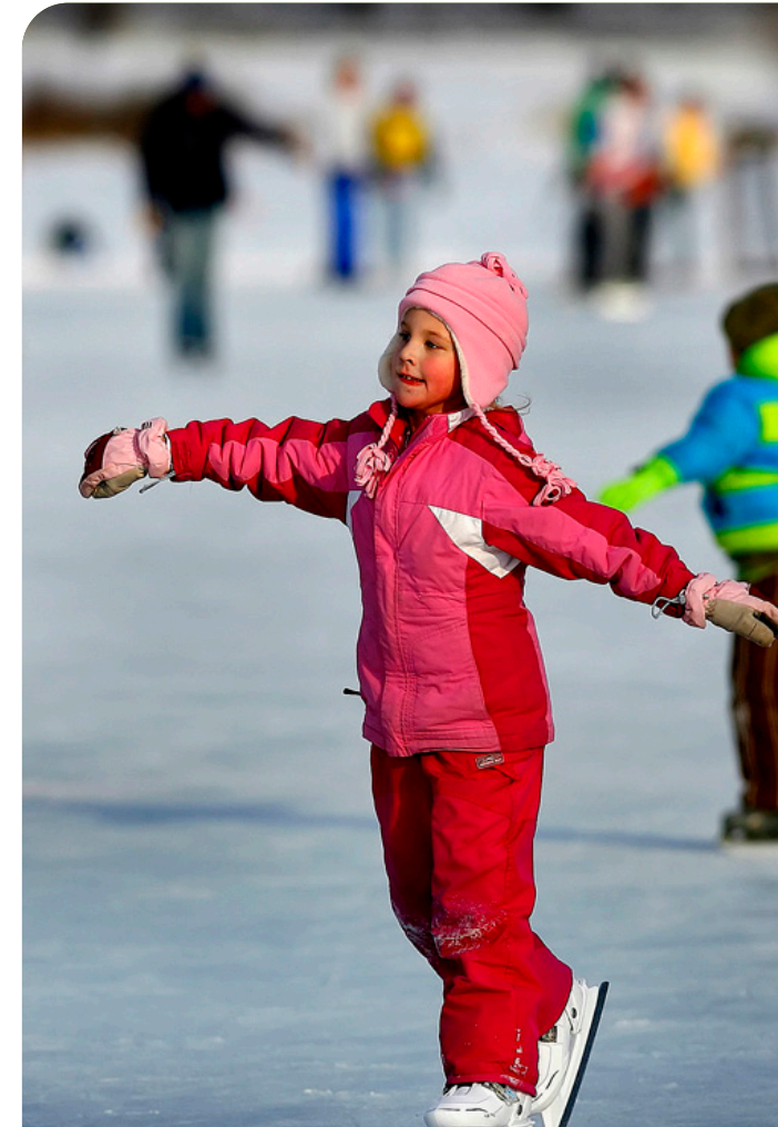
Patinaje sobre hielo en Lake of the Isles

Re imaginar programas de fondos empresariales e instalaciones a través del sistema basado en enfoques impulsados por el mercado que equilibren la ecología y los usos recreativos.