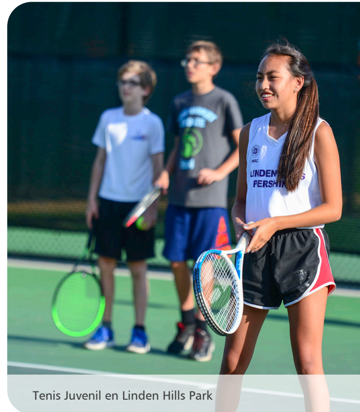
Tenis Juvenil en Linden Hills Park