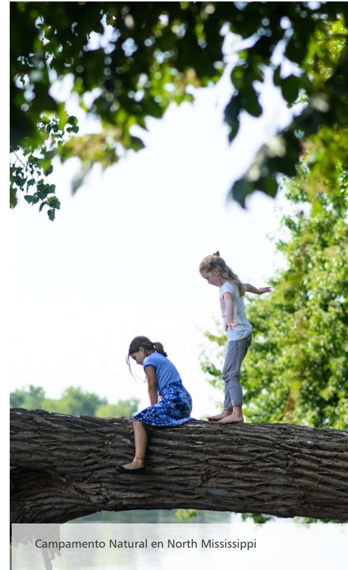
Campamento Natural en North Mississippi

El sistema del parque es equitativo, sustentable, cuidado, hermoso y seguro. Cumple las necesidades de los individuos, familias y comunidades cruzando cultura, raza/etnicidad, idioma, habilidad, geografía, generación y género. Areas naturales en el sistema equilibran el floreciente hábitat y el considerado y equitativo acceso al parque. A través de narración y experiencia, MPRB fomenta el orgullo en los usuarios del parque y el personal, y cultiva una nueva generación de orgullosos representantes y defensores de un extraordinario sistema de parques y recreaciones.