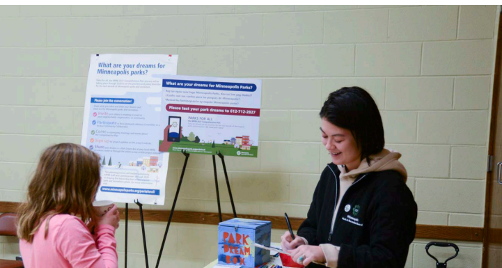
Parques Para Todos y Colaborador de alcance a la Comunidad en el evento de Solsticio de Invierno en McRae

Invertir en centros de tecnología informática para apoyar al desarrollo de las habilidades de la informática, proyectos creativos, programas digitales y remotos y acceso a empleos.