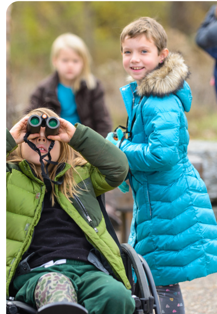
Campamento de Exploradores de la Naturaleza en North Mississippi Park

Apoyar las iniciativas de comunidades adyacentes a los parques para abordar el crimen mientras se respetan las comunidades de los alrededores y la cultura.